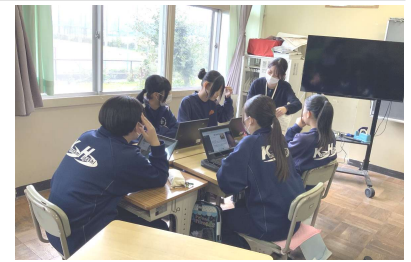
▲役場の方とグループワークの様子

本校では、令和5年度より3年生の「総合的な学習の時間」において「函南町への提言」に取り組んでいます。地域の現状や課題を理解し、その解決策を自ら考え、地域社会に向けて発信することを目的としている学びです。活動は、町の現状分析から始まり、観光・防災・福祉・環境・産業など多岐にわたるテーマを設定します。今後、完成した提言は資料としてまとめ、町職員、地域関係者の前で発表し、質疑応答を通して内容をさらに深める予定です。