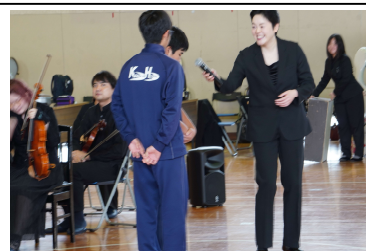
▲指揮者にインタビューされる指揮者体験の生徒

10月24日（金）体育館にてオーケストラによる演奏会を開催しました。楽器紹介では、弦楽器・木管楽器・金管楽器・打楽器など、それぞれの音色や仕組みについてわかりやすく説明していただき、音とともに楽器の魅力を間近で感じることができました。指揮者体験のコーナーでは、2名の生徒が実際にタクトを振り、オーケストラを指揮する貴重な体験をしました。緊張しながらも堂々と指揮する姿に、会場から大きな拍手が送られました。