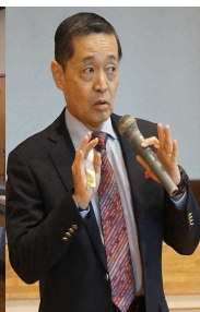
P T A 教養講座「ペップトーク」