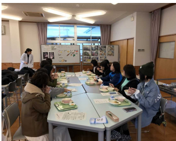
給食試食会の様子