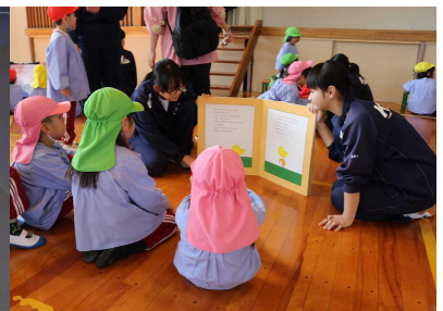
春光幼稚園との交流(2年)